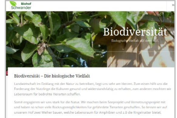
Auf der Hofwebsite