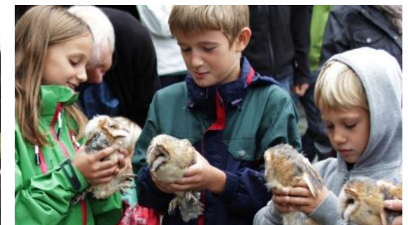
Mit der Beteiligung an Events