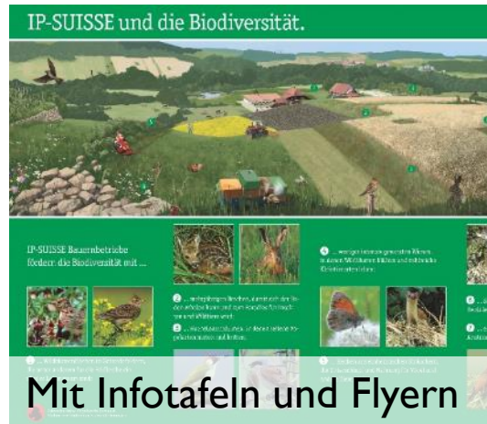
Mit Infotafeln und Flyern