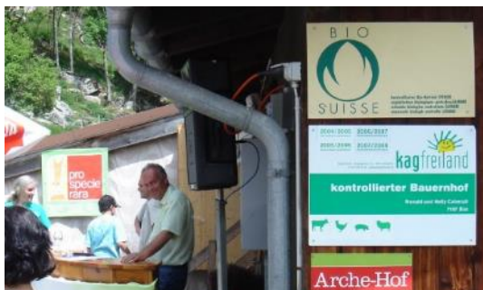
Im Zusammenhang mit Labelproduktion