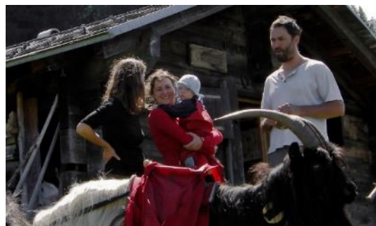
Mit Angeboten für Schulen und Touristen